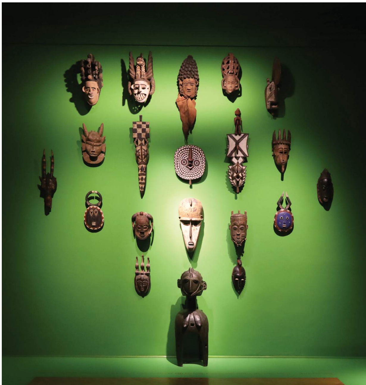
A belső terem főfalán Jankay Tibor maszkgyűjteményéből állítottunk össze egy válogatást a harsogó tavaszi zöldek által inspirált háttéren. Ahogyan a művész a lakásában és a műtermében, úgy mi sem csoportosítottuk származásuk szerint a műtárgyakat