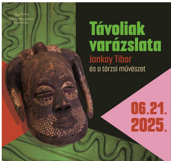
A kiállítás utcai reklámja a Munkácsy Mihály Múzeum homlokzatán (255x255 cm)