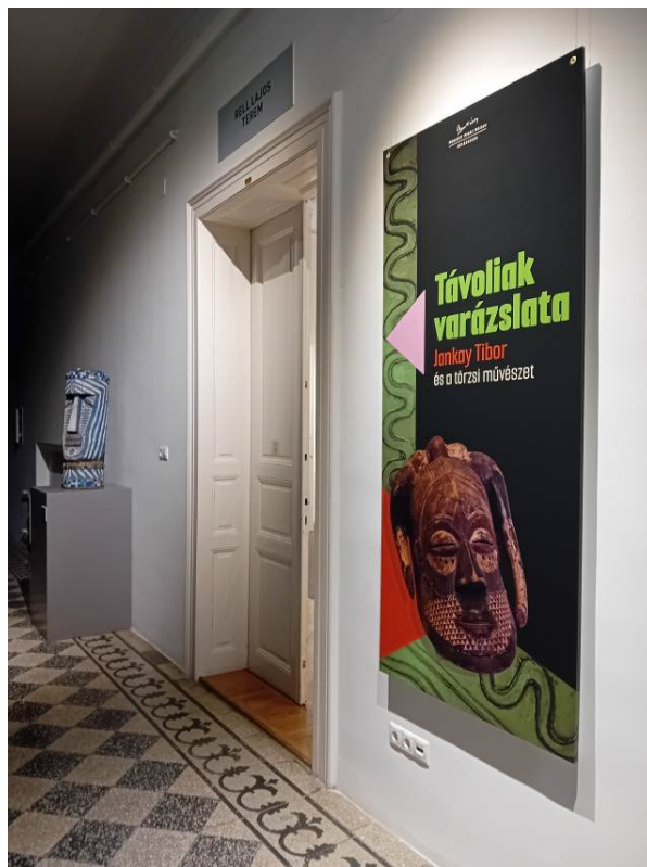
A tárlat nagyméretű plakátja a kiállítóterem bejáratánál 200x100 cm méretű