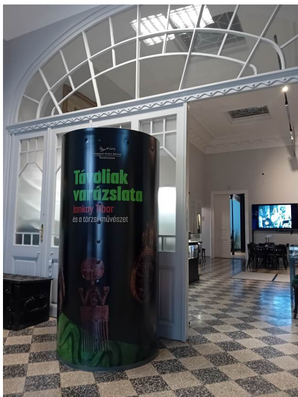
A tárlatot beharangozó hirdetőoszlop a múzeum lépcsőházában (palást mérete: 200x320 cm)