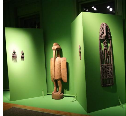
Afrikai tárgyak a kiállításban