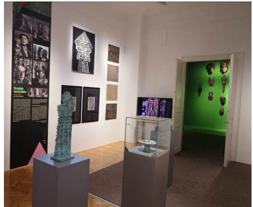
A törzsi művészet által inspirált Jankay-műveket az első teremben mutatjuk be