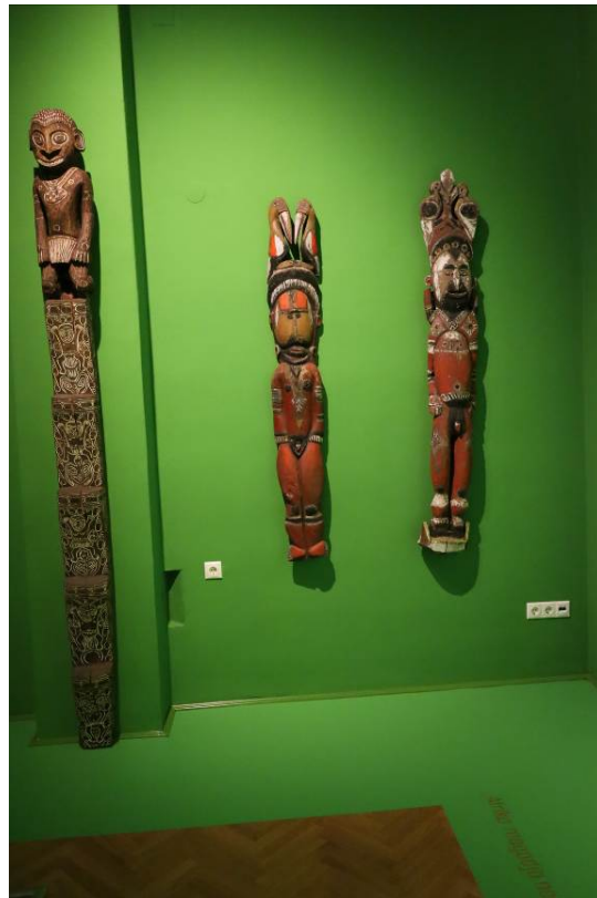
Indiai, amerikai és afrikai tárgyak