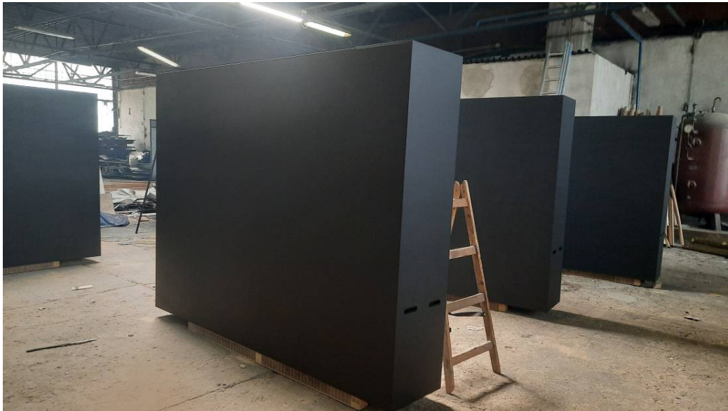
A parvánokról készült fotó még az asztalosműhelyben született. A festéshez megemelték a dobozokat, de a kerekek csak minimálisan tartják a hasábokat a levegőben, szinte a padlón nyugszanak.