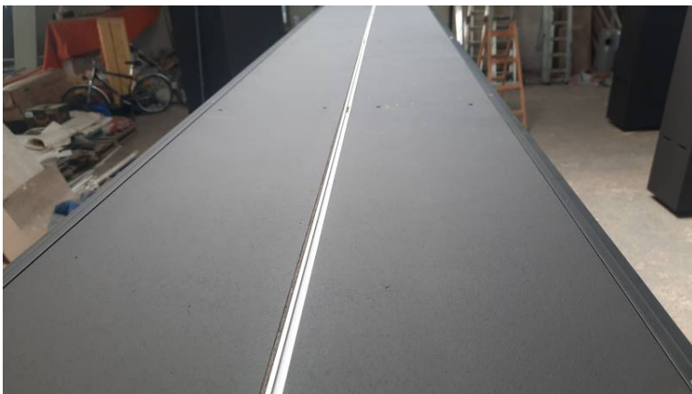
A parvánok tetején rejtett sín fut végig.