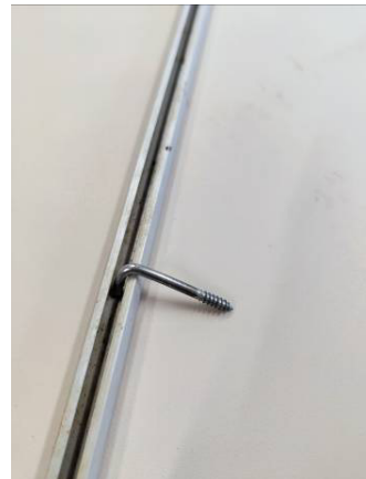
A függesztést a filléres kulcsakasztó kampóval oldjuk meg, amelyre könnyen rögzíthető a drót.