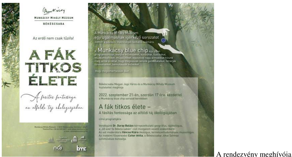
A rendezvény meghívója