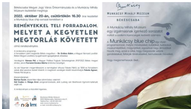
A rendezvény meghívója