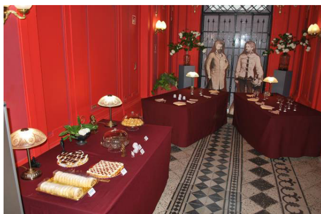
A múzeumi Entrée Classic