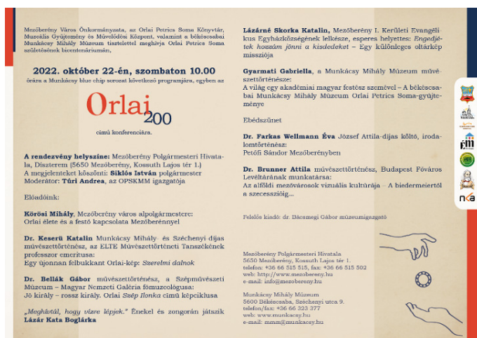
A rendezvény meghívója