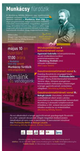
A rendezvény meghívója

Amellett, hogy betekintést nyújtottunk Ostende multikulturális nemzetközi sikertörténetének fejezeteibe, megmutattuk, milyen rekreációs lehetőségek várták Munkácsy Mihályt a hús vizű Északi-tengernél töltött pihenése során. A művészettörténeti közeget és a gasztronómiát is érintő, valamint a korabeli fürdőzési szokásokkal egyaránt foglalkozó, július 2-ig látogatható kiállítás nosztalgikus hangvétellő kultúrtörténeti meditáció lehetőségét biztosította a múzeum látogatói számára.