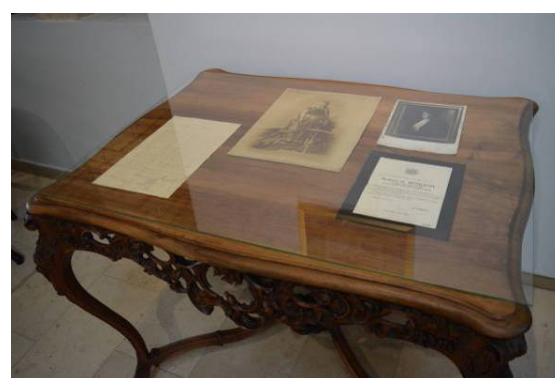
A programhoz kapcsolódó kamarakiállítás a Munkácsyné személyéhez kötődő relikviaegyüttessel