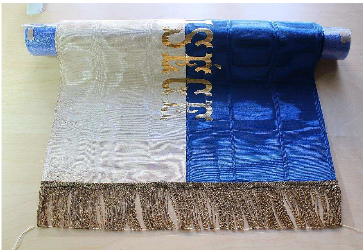
Az elkészült szalag – megmentve az utókor számára...