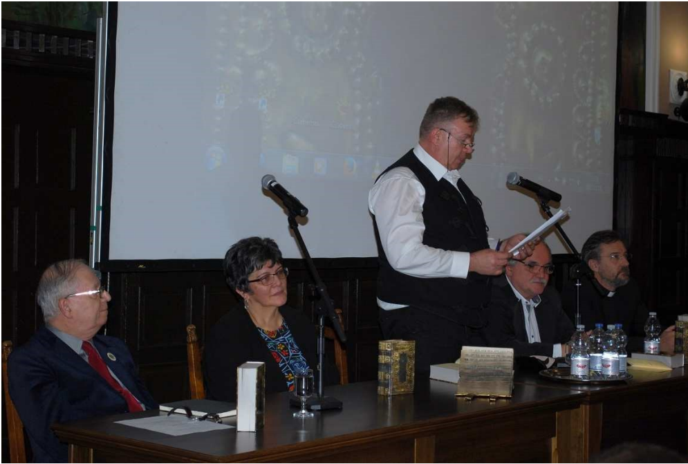
A könyvbemutató közreműködői