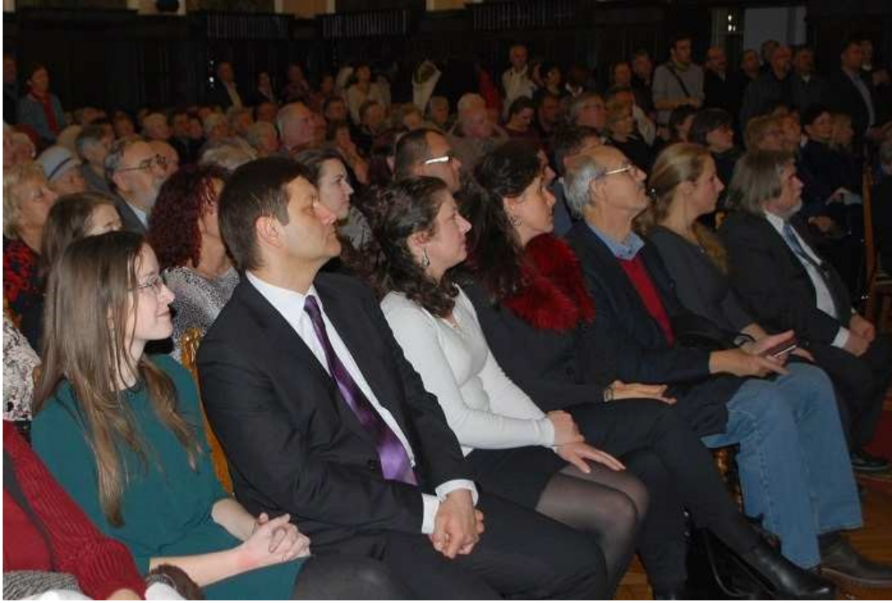
Az évkönyv szerzői

Békéscsaba Megyei Jogú Város Önkormányzata, a Munkácsy Mihály Múzeum és a Békéscsabai Evangélikus Egyházközség tisztelttel meghívja Önt és ismerőseit az