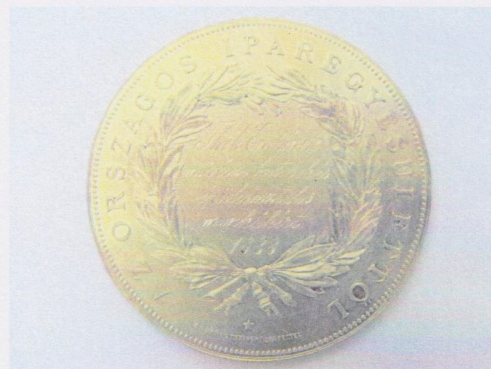
A megvásárolt érme elő- és hátoldal