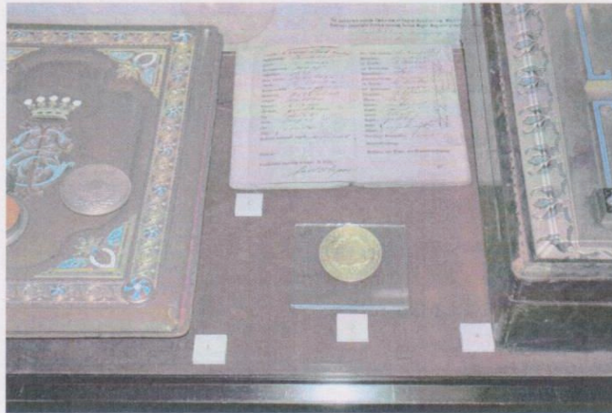
Thék Endre aranyérméje kiállítva más Thék-relikviákkal együtt

eredetileg kért árból engedett. Az egymillió forintért megvásárolt érmet a történeti gyűjteménybe leltároztuk be, majd több mint egy hónapon át kiállítottuk Békéscsabán.