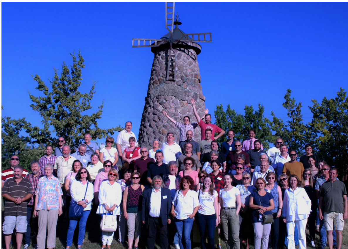
A konferencia résztvevői a Történelmi Magyarország közepét szimbolizáló emlékhelynél