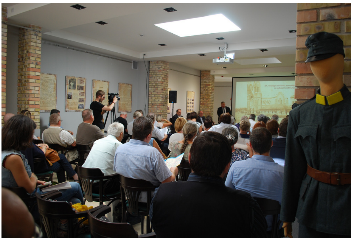
A konferencia megnyitója