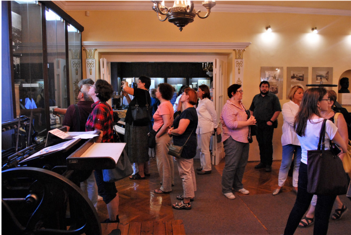
A Gyomai Kner Nyomda történetét bemutató kiállítás