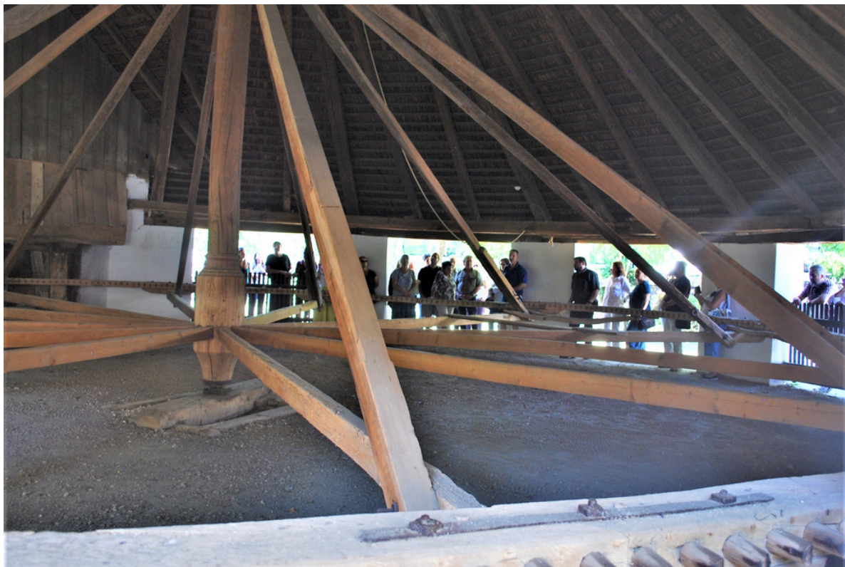
Látogatás a szarvasi szárazmalomban