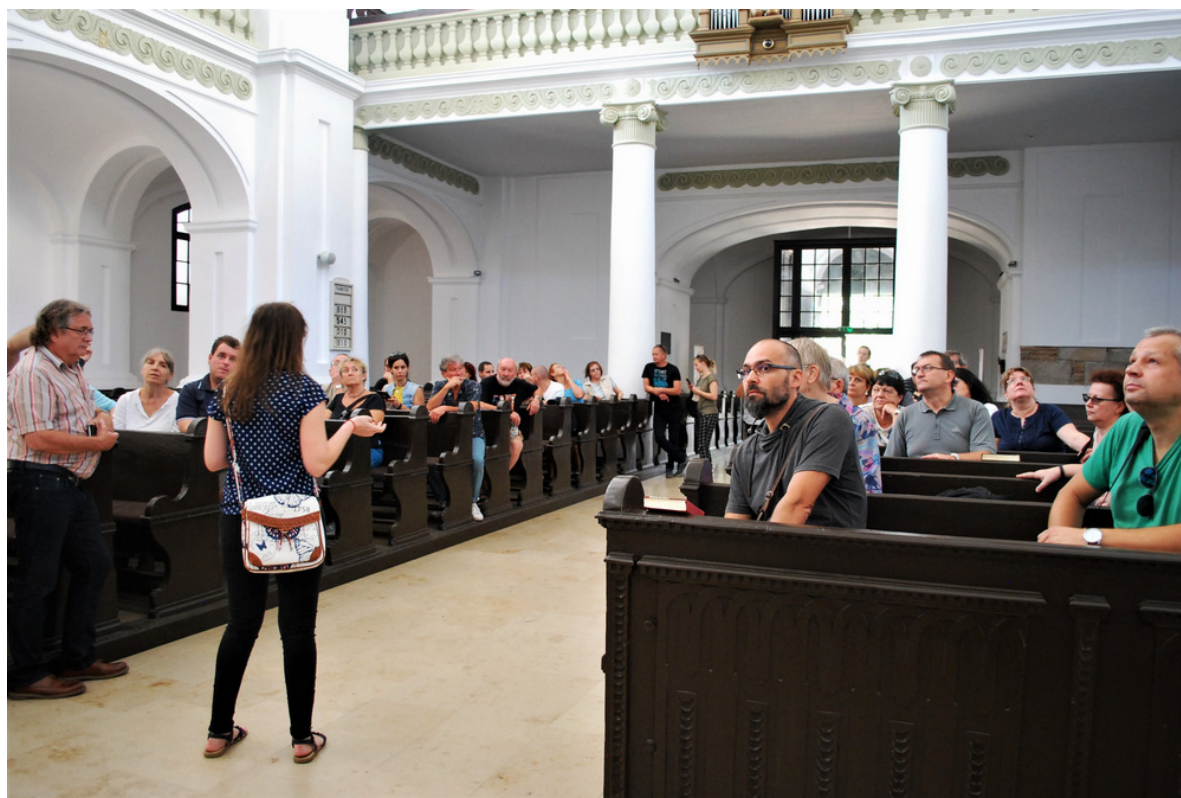
A békéscsabai evangélikus nagytemplom felkeresése