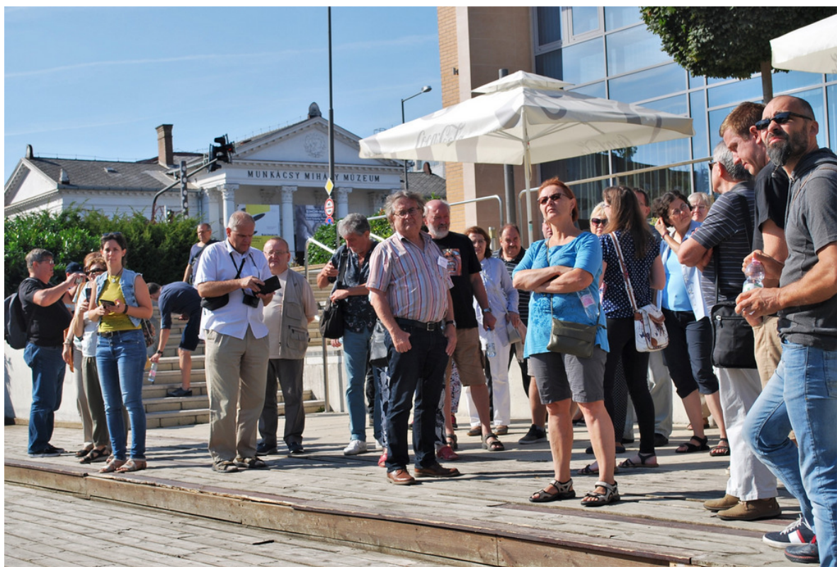
Ismerkedés a város történetével