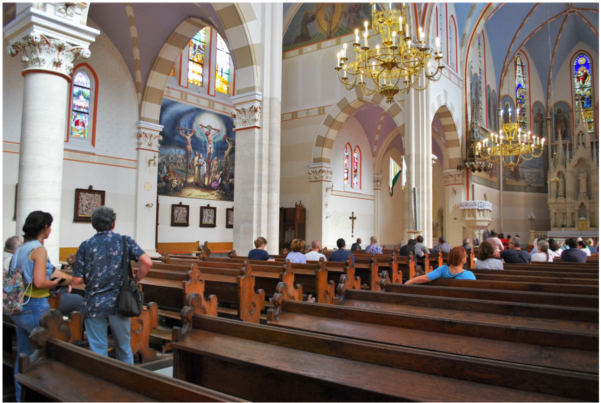
A Pádai Szent Antal Társszékesegyház megtekintése