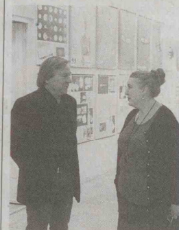
A tárlat a múzeumban január 6-áig látogatható