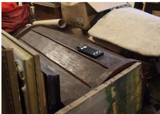
Orlai Petrics Soma Kulturális Központ Muzeális Gyűjtemény, Mezőberény