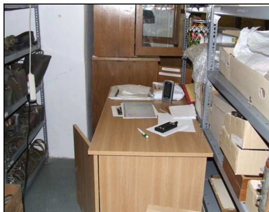
Bereczki Imre Helytörténeti Gyűjtemény, Dévaványa