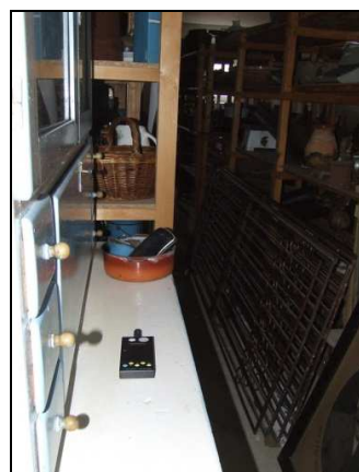
Nagy Gyula Területi Múzeum, Orosháza