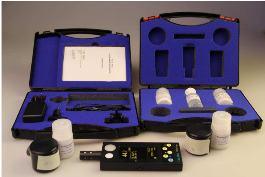
Elsec 765C környezeti monitor és páraszenzor kalibráló szett