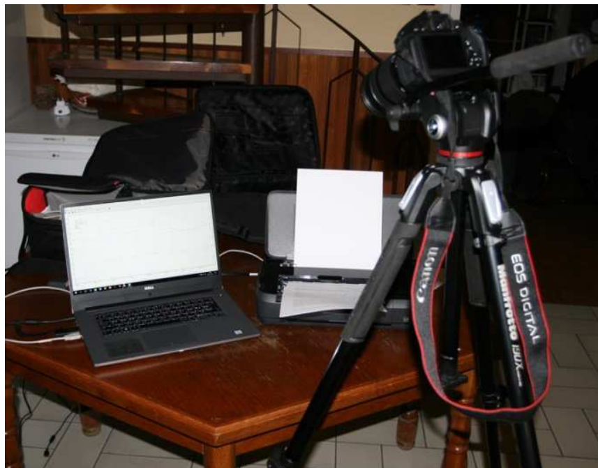
Fényképezőgép tartozékokkal, nootebook és hordozható nyomtató